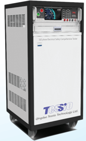
ซีรีส์ TES-9800 เครื่องทดสอบ-แหล่งจ่ายไฟ (หรือ Isolated transformer)