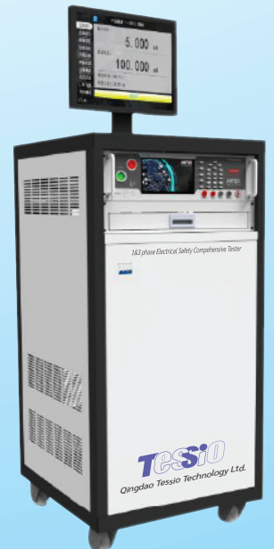
ซีรีส์ TES-9800 เครื่องทดสอบ-Isolated Transformer (คอมพิวเตอร & โปรแกรม : อุปกรณ์เสริม)